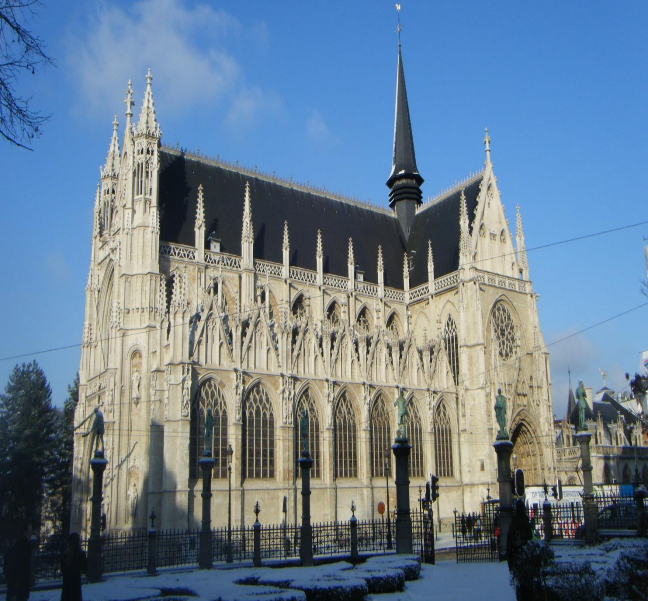
Notre Dame du Sablon